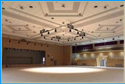
会場ひろびろ。三密対策

琉球舞踊家、スポーツ愛好者で、グループでの参加希望の方は、別途 日時等について調整可能です。お気軽にご相談ください。 準備していただくもの ヨガマット、バランスボール（なければこちらでご準備します） 膝まで裾が上がるズボン、タオル、マスク。 素足でおこないます。